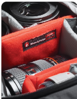
뛰어난 보호 시스템