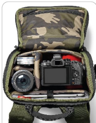
가방 상단 장비 접근성