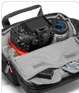
가방 상단 장비 접근성