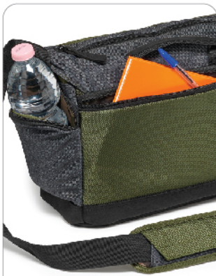
카메라 · 렌즈 외 개인 수납 공간