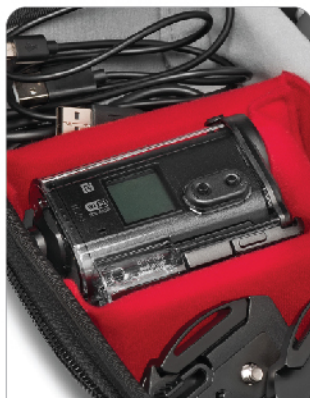
다양한 수납 공간