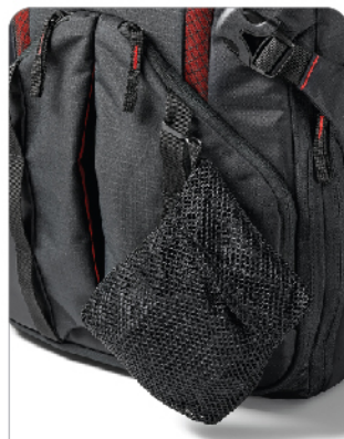
비 / 자외선 차단 커버