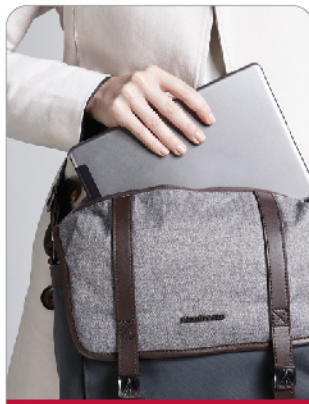
노트북 및 다수의 수납 공간