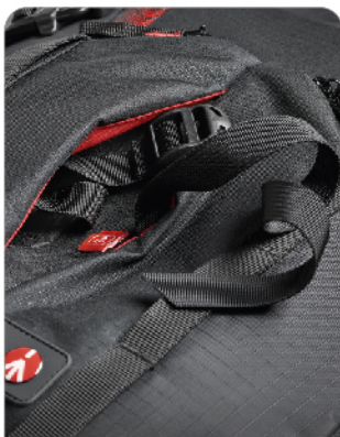
새로운 방식의 삼각대 체결 방식