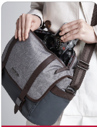
가죽 트리밍 및 우아한 패브릭 조합