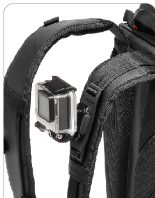
다방면의 시각에서 촬영