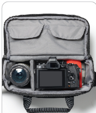
미러리스 세트 휴대 가능