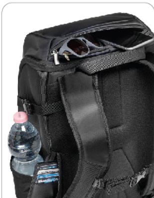
카메라 · 렌즈 외 개인 수납 공간