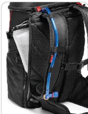
레인커버 & 하이드레이션팩 (선택)