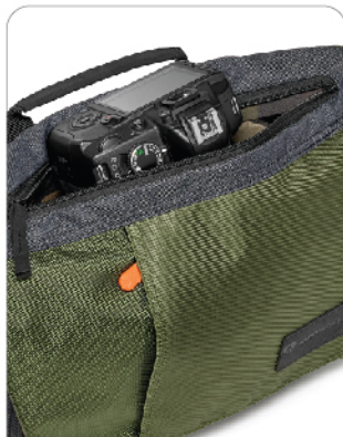
장비 접근성을 위한 지퍼