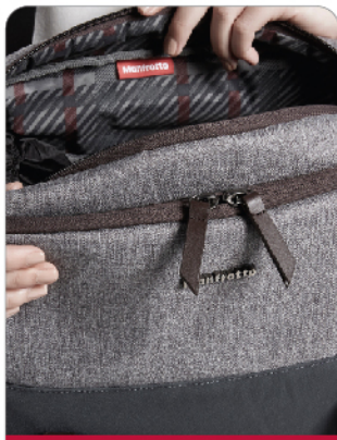
타탄 패턴의 세련된 디자인